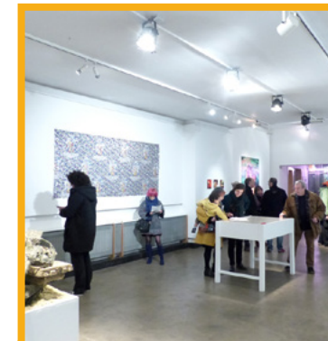
Le hall d'exposition

SURFACE : 72 M 2 D'ŒUVRES EXPOSÉES ET 27 M 2 AU NIVEAU DE L'ESPACE ACCUEIL